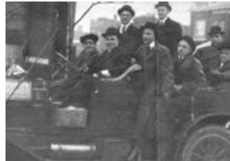
Foto: Herculaneum'i tantsuklubi meesliikmed