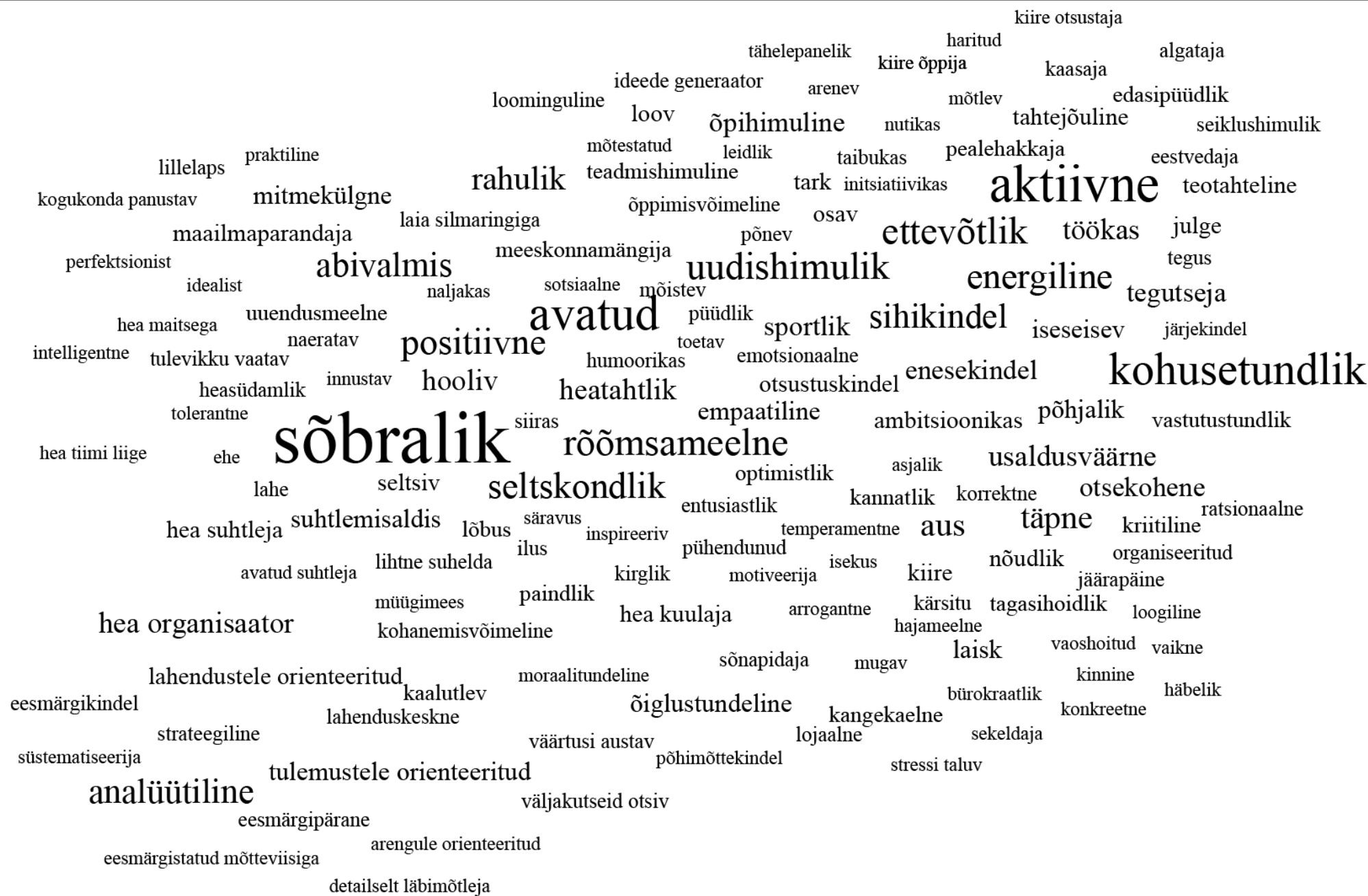
Joonis 5. JCI Estonia organisatsiooniliikmete jaotuvus eneseiseeloomustuse järgi